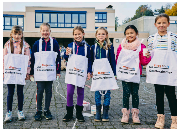
16_Schülerinnen der Mittelpunktschule Gadernheim