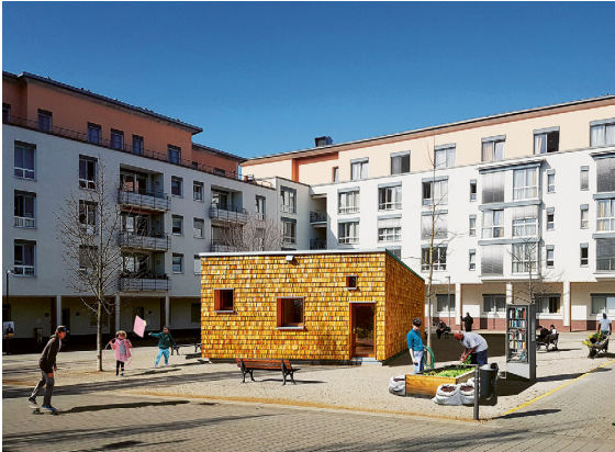
1_Das fliegende Künstlerzimmer im Quartier © Michel Müller & Nikolaus Hirsch