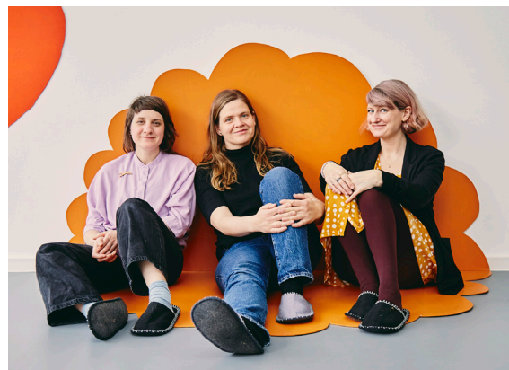
22_Gongworkshop im Crespo Studio mit Schüler:innen der Einhardschule