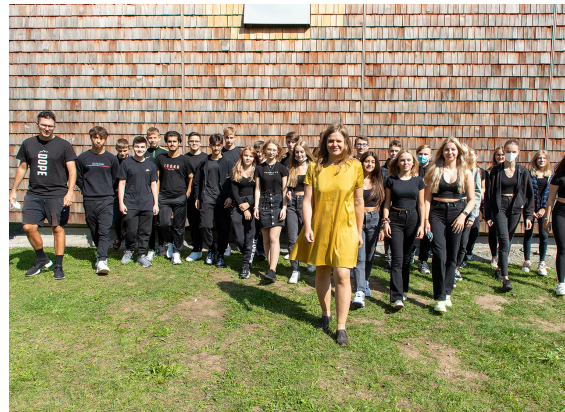
12_Christina Wildgrubes Erstbegehung der Einhardtschule