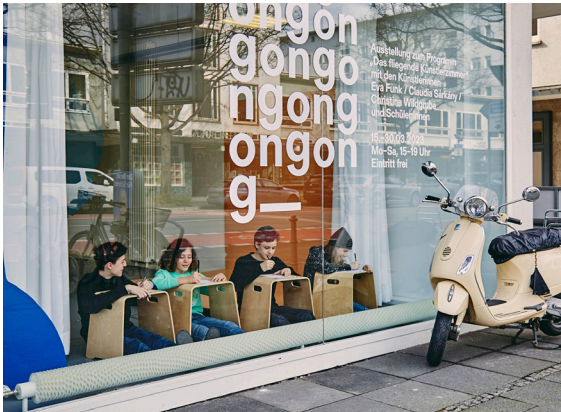
17_Gongworkshop im Crespo Studio mit Schüler:innen der Einhardschule