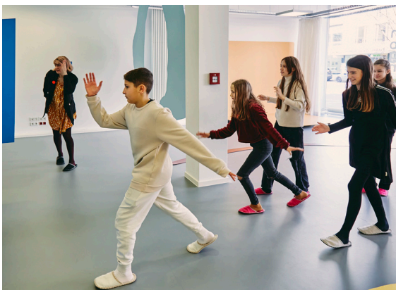
19_Gongworkshop im Crespo Studio mit Schüler:innen der Einhardschule