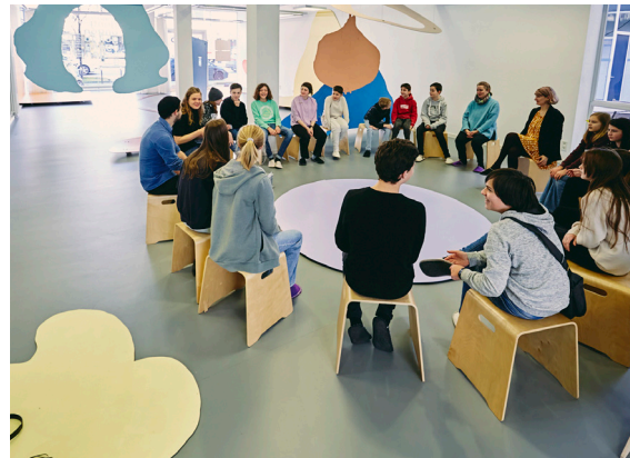
18_Gongworkshop im Crespo Studio mit Schüler:innen der Einhardschule