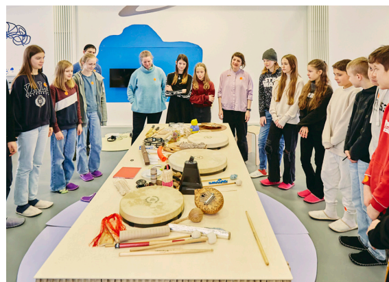
20_Gongworkshop im Crespo Studio mit Schüler:innen der Einhardschule