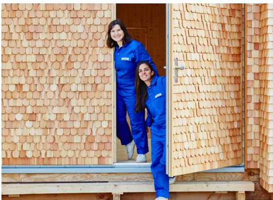
15_Das Künstlerinnenduo g.a.d.o. an der Stadtschule Schlüchtern