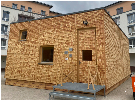
9_Das fliegende Künstlerzimmer ist gelandet