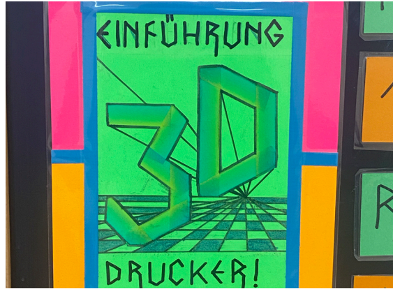
8_Workshop im fliegenden Künstlerzimmer