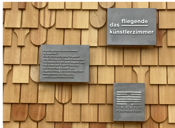
10_Das fliegende Künstlerzimmer ist gelandet