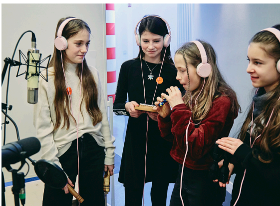
21_Gongworkshop im Crespo Studio mit Schüler:innen der Einhardschule